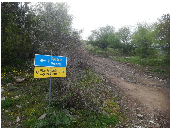
Start vanaf de weg Kapesovo – Vradeto.